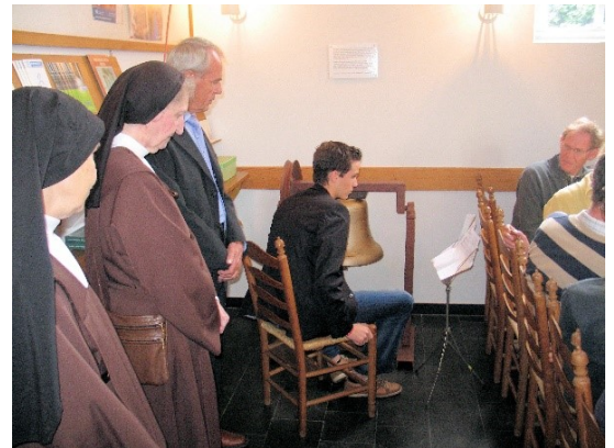
De Karmelklok "Theresia van Avila" speelt een rol in de inwijdingsdienst

De hervormde kerk in Beek stond altijd open voor andere kerkgemeenschappen. Zo waren er in de weken na de bevrijding van Beek door de Amerikanen op 17 september 1944 in de kerk voortdurend kerkdiensten van Methodistische, Baptistische, Anglicaanse, Schots Hervormde en ook Joodse kerkgemeenschappen.