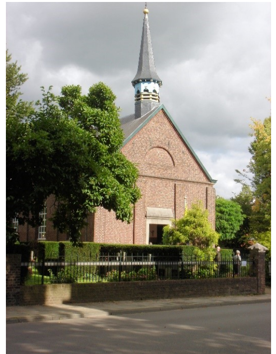
Het Hervormde kerkje in Beek

De oprichting van een eigen gemeente te Beek moest wachten tot na de vrede van Munster (1648). De Verenigde Nederlanden werden onafhankelijk van Spanje en van de Keizer. Helaas regelde het vredesverdrag niet welke plaatsen in onze streek bij de Nederlandse Staatse republiek kwamen en welke bij Spanje bleven. De Republiek wilde vrijheid van godsdienst (voor zowel protestant als rooms-katholiek), maar Spanje wilde absoluut geen ruimte aan de protestanten geven. Het gevolg was dat de oorlog in onze streek ook na 1648 doorging. Zoals gezegd, begonnen in Beek in 1651 de hervormde kerkdiensten in de Dorpskerk.