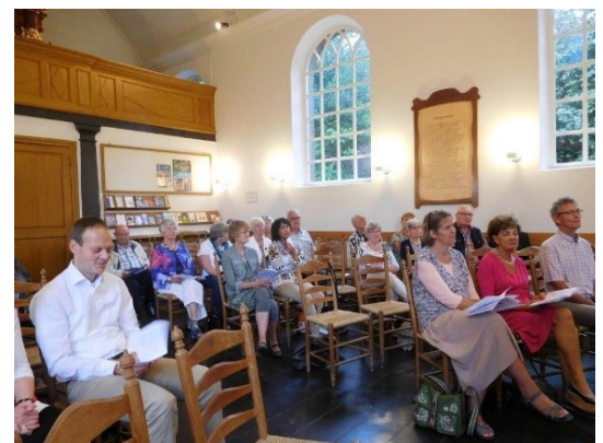
Bevestiging van diakenen