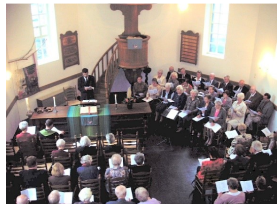
De cantorij werkte meer dan veertig jaar mee aan de diensten