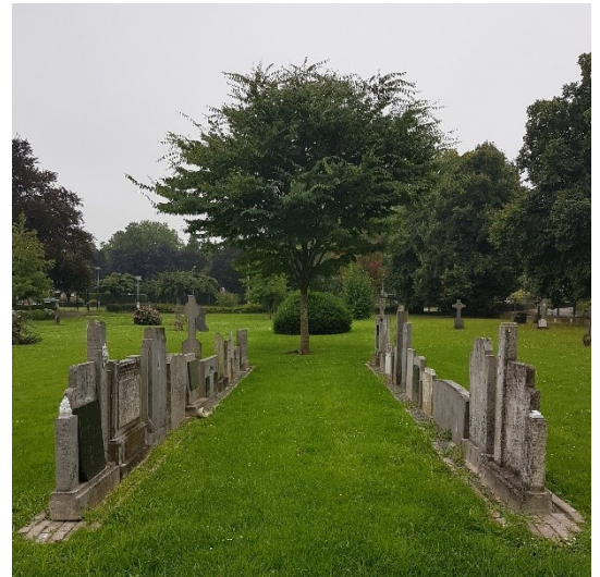
Grafstenen vonden een nieuwe plek, het gedenkpark 'Sint Martinus' in Beek

In 2016 werd besloten het kerkcomplex te Beek te verkopen en het kerkgebouw op termijn te verlaten. Door de afname van het aantal kerkleden in Beek en omgeving en de diverse kerkfusies was het gebouw in feite overbodig geworden. In 2017 werd het kerkhof bij de kerk geruimd. De grafstenen vonden een nieuwe plek op het oude algemene kerkhof in Beek, nu het gedenkpark 'Sint Martinus'. In 2023 was de met de koper overeengekomen overgangstermijn voorbij. Op 3 september 2023 vond de laatste dienst plaats.