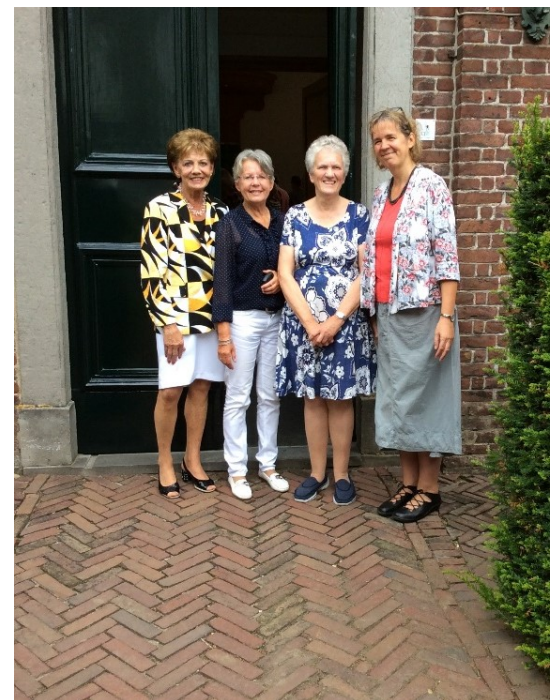
Vier vrouwen voor de kerk, die samen de dienst verzorgden - diaken, organist, oudste en voorganger.