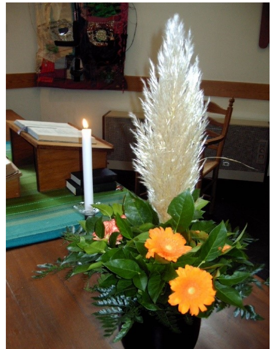
Het liturgisch centrum in 2023

De roomsen probeerden bij iedere oorlogsinval met behulp van de bezetter de protestantse gemeente de nek om te draaien. Zo