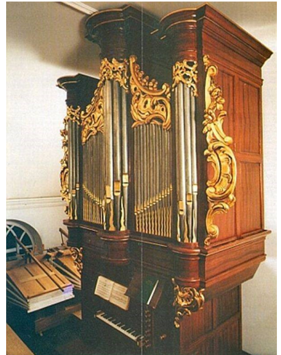
Het de Rijckere orgel in volle glorie op het balkon

Ruim 100 jaar lang heeft in het torentje van de Protestantse kerk in Beek de klok gehangen, die in 1838 door de klokkengieters de gebroeders Goulard in Tongeren speciaal voor de toen nieuwgebouwde hervormde kerk was gegoten. Op 7 januari