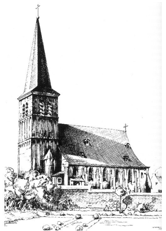
De oude dorpskerk van Beek